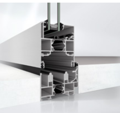
Schüco ASS 70 FD in HD-Ausführung Schüco ASS 70 FD in HD design